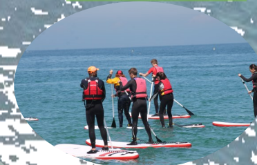
Stand Up Paddle